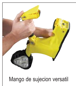
Mango de sujecion versatil