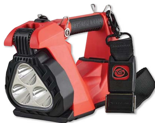
Modelo Naranja incluye correa de liberación rápida para hombros.