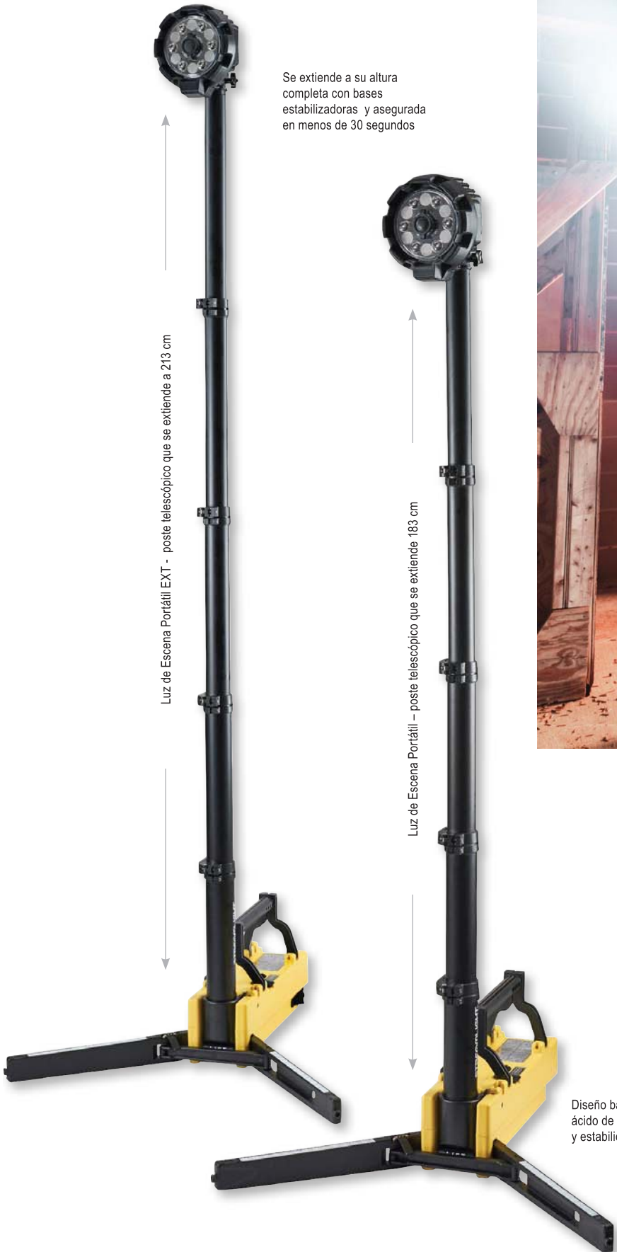
Luz de Escena Portátil EXT - poste telescópico que se extiende a 213 cm