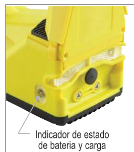
Indicador de estado de batería y carga