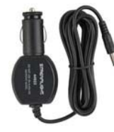
Cable Adaptador 12V DC