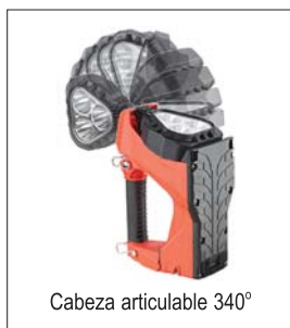
Cabeza articulable 340°

Base cumple con los requerimientos de NFPA 1900-11.1.11.2 (2024) Montada en cualquier posición