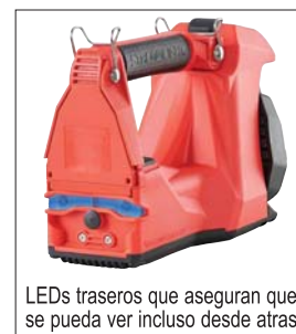
LEDs traseros que aseguran que se pueda ver incluso desde atras