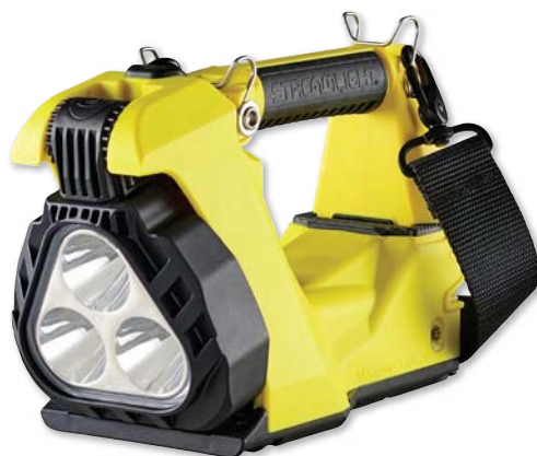
Modelo Amarillo incluye correa de alta Resistencia para hombros.