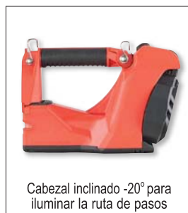
Cabezal inclinado -20° para iluminar la ruta de pasos