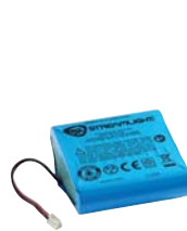
Litio Ion Batería